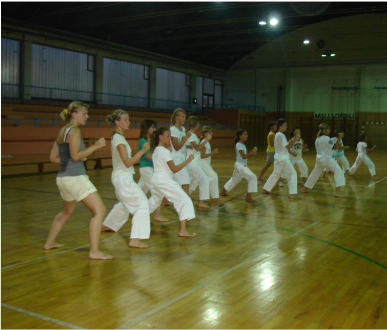
Trebalo je izdržati sparinu i vrućinu u dvorani

Treninzi su se održavali u sedmom mjesecu svake subote u dvorani od 20:00 – 21:00 h. Da nije bilo lako govori da je u dvorani znalo biti vruće i do 30 stupnjeva. Oni najuporniji sve su izdržali. Uglavnom su se radile bazične pripreme na izdržljivosti, snazi i kondiciji, a u osmom mjesecu počelo se sa treninzima dva puta tjedno, a u zadnja dva tjedna i sa završnim pripremama na kojima se uglavnom radio natjecateljski program za borbe i kataše. Na treninzima su uglavnom prisustvovali oni od kojih se i najviše očekuje na budućim natjecanjima, a svojim redovnim dolaskom na treninge u ekipu kluba nametnuli su se i neki novi članovi kluba.