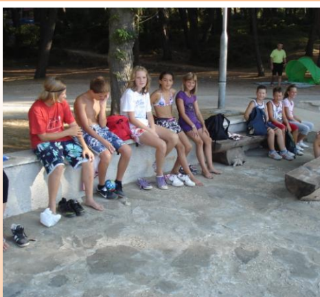
Poslije trčanja na plivanje