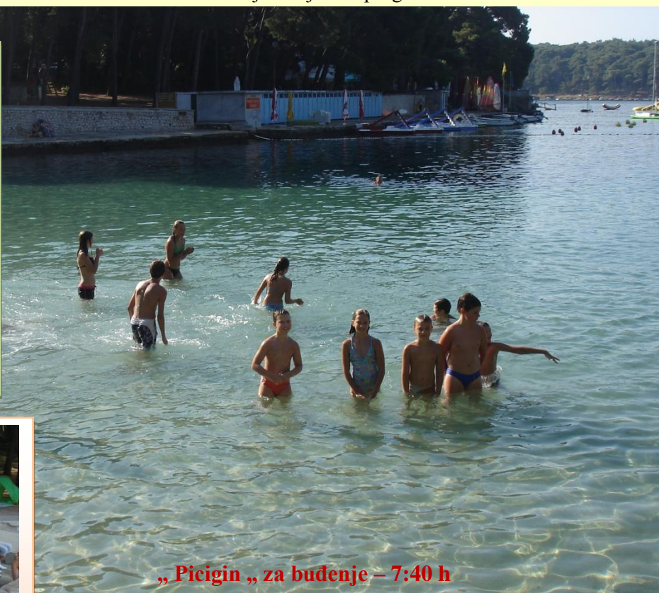
„Picigin „ za buđenje – 7:40 h